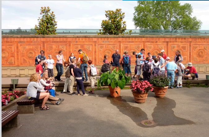
Familienausflug in die Wilhelma

In unserem Verein besteht ebenfalls die Möglichkeit Leistungssport zu betreiben. Unsere Unterwasser-rugbymannschaft ist sehr erfolgreich.