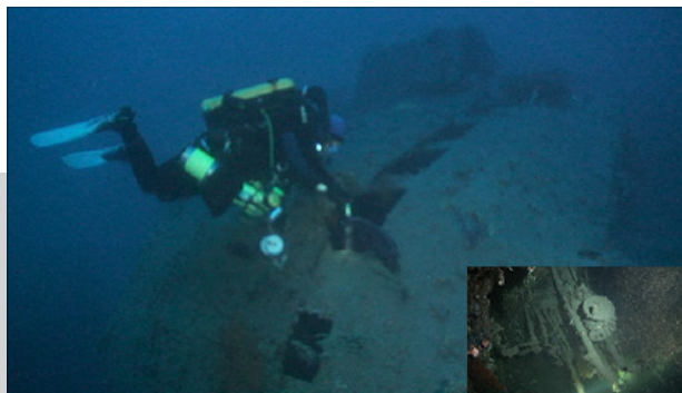
Tauchen am Wrack auf 98 m Tiefe

Technisches Tauchen oder Tec Diving bezeichnet eine fortgeschrittene Form des Sporttauchens. Mit Hilfe des Einsatzes von Helium ist es möglich die Grenzen von 30m zu durchbrechen und in Tiefen bis zu 100m und mehr vorzudringen. Unberührte Tauchplätze oder Expeditionen zu tiefen, teils noch nicht betauchten, Wracks werden möglich. Bis 45m Tiefe lässt sich die normale Tauchausrüstung verwenden. Soll es tiefer gehen, ist eine spezielle Ausrüstung und eine spezielle Ausbildung notwendig. In Zusammenarbeit mit anderen Vereinen bieten wir die notwendige Tauchausbildung an. Darüber hinaus besitzt der TSV Malsch die notwendige Infrastruktur zur Herstellung der speziellen Mischgase.