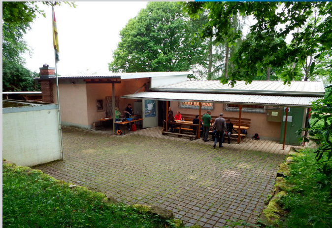
Vereinsheim des TSV Malsch e.V.